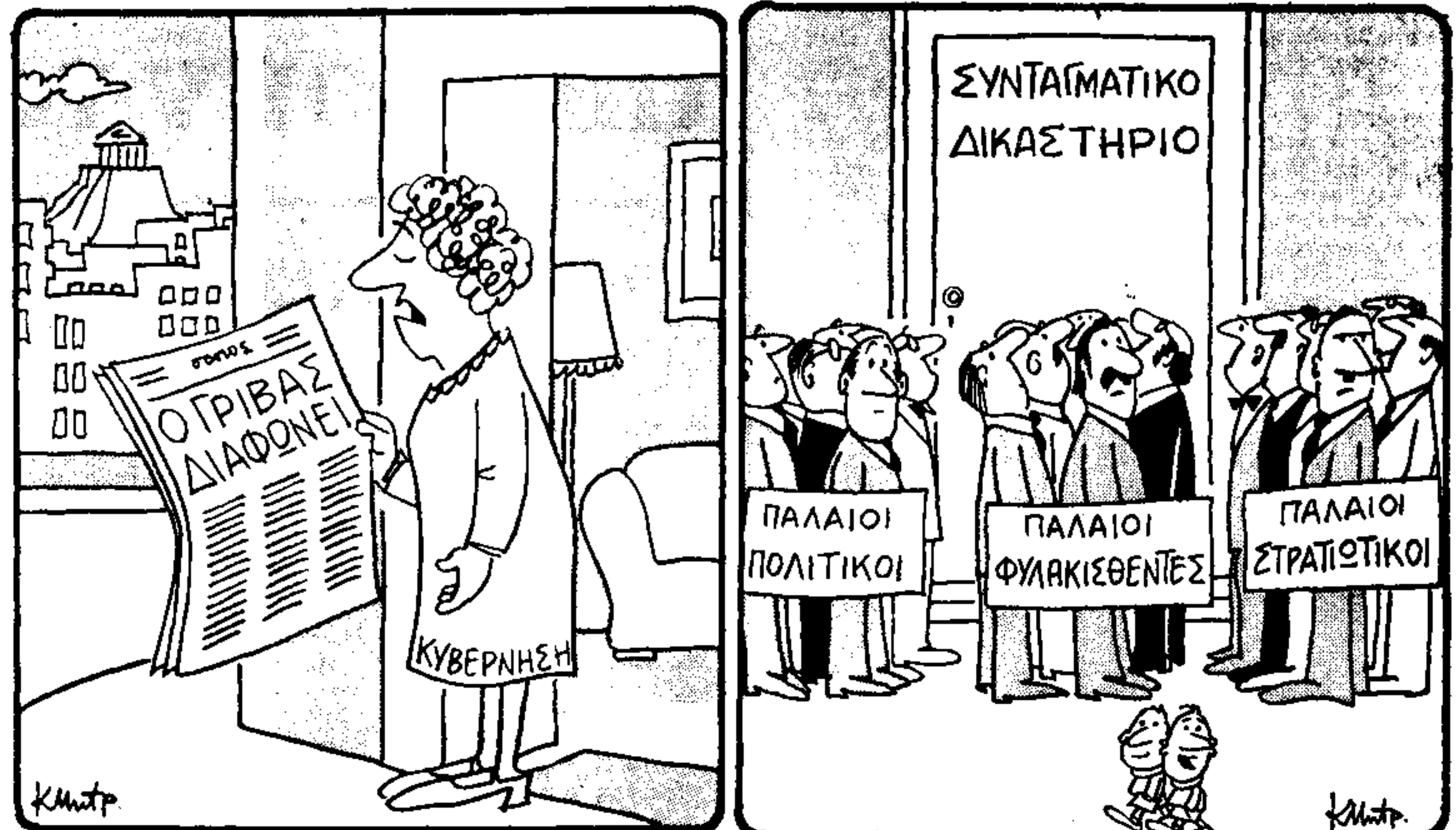
— 'Ας συμφωνήσω μαζί μου κ' ένας δρέ όδωφρέ. Μπαράκι τόχα... — Σκέφω τώρα να έμμανιστούν και τί- ποτα... παλαιό βασιλείς!